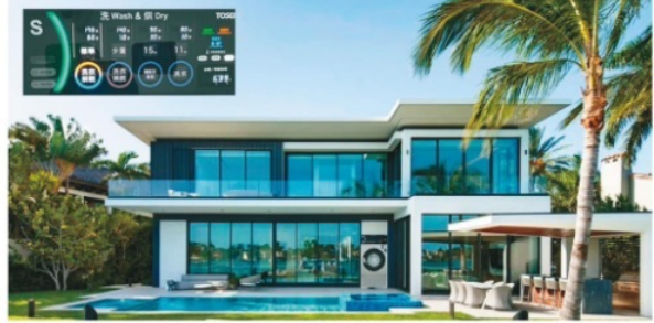
宏閩自助洗衣多樣化，高規格設備單租電源豪宅規畫諮詢。

由於疫情致使個人經濟快速崛起，自助洗衣店也一樣持續蓬勃發展，進而帶動了整個市場的變化，大型滾筒洗衣店也面臨轉型，猶如當年超商革命一樣，洗脫烘機器的便利性