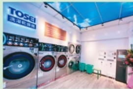
▲City-Wash洗衣房舒適空間，採用最先進設備，目前在全台已有400多家分店。