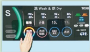
▲因應疫情所設計的「隔空洗衣」設備，手靠近即可感應操作，減少相互感染機率。