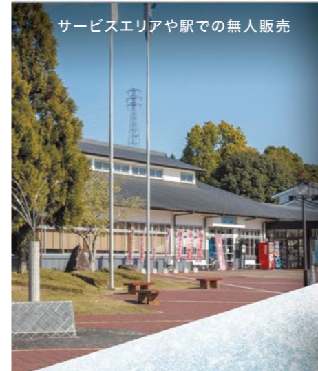
サービスエリアや駅での無人販売