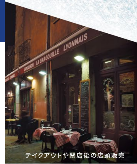
テイクアウトや閉店後の店頭販売