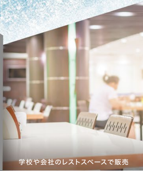
学校や会社のレストスペースで販売