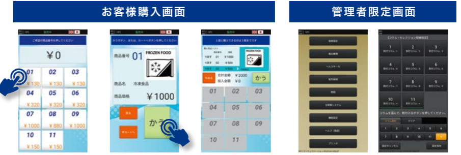
対象の番号を押して、ボタンを押すだけ まとめて購入も可能 ストッカーの割付けや価格の変更も簡単

販売時はお客様をサポートする購入画面として、設定を行う際は販売機の様々な設定を行える管理画面として使用することができます。専門知識がなくても簡単に操作可能です。