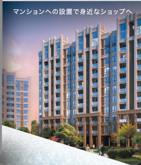
マンションへの設置で身近なショップへ