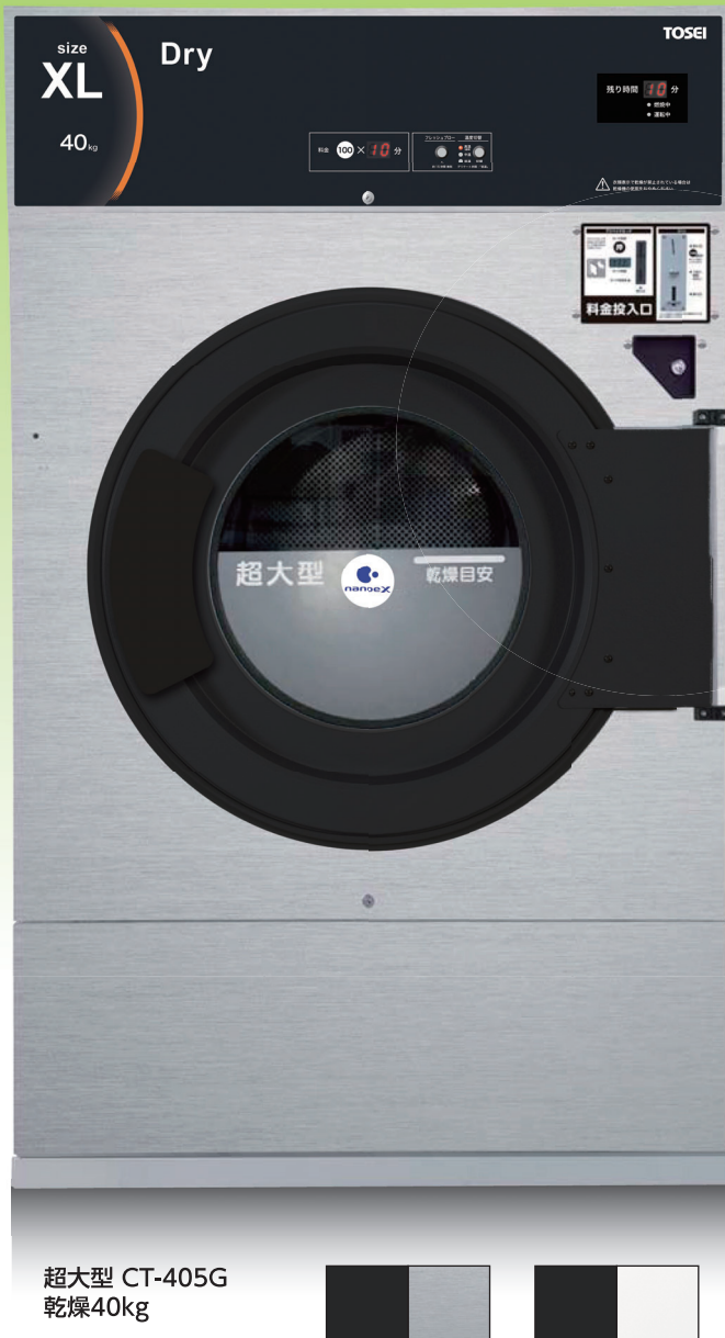
超大型 CT-405G 乾燥40kg